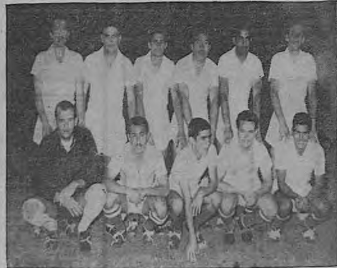
EL SAPRISSA DISPUESTO A DEFENDER EL PRESTIGIO DEL FUTBOL NACIONAL FRENTE AL MEJOR EQUIPO DE AMERICA

Pero tenemos que ir hasta el final; y fuimos a volver a servir de trampolín para las aspiraciones del fútbol costarricense ya que todos nuestros esfuerzos serían por nada —si no se lograba el game, y esto fue precisamente lo que aconteció—. Ganaron los TICOS y con ello se esfumó para Honduras, la posibilidad de llegar a competir con México —lo que equivale a decir: que volvimos a quedar nos en la antelana, cuando podríamos haber dado un paso más en la superación de nuestra deporte”.