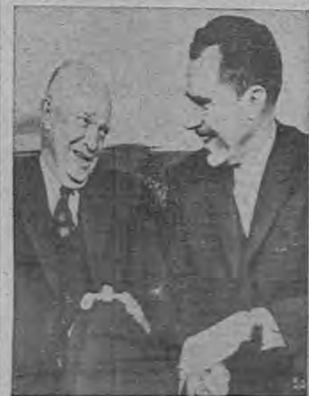
CHARLA DE DESPEDIDA. — El Presidente Eisenhower y el Vice-Presidente Nixon conversan en la oficina del Presidente, en la Casa Blanca, sobre lo que Nixon llamó "una última charla de despedida".

maria rápidas medidas para aumentar la distribución y variedad de alimentos excedentes a las secciones de desempleo crónico.