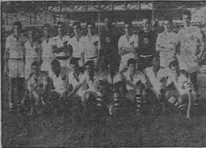
EL SANTOS DE BRASIL INICIA LA SERIE TRIANGULAR ENFRENTADO AL ELENCO MORADO

El Santos volvió a entrenar ayer en las horas de la tarde a fin de que los futbolistas estén en perfectas condiciones para el juego de hoy. Se iniciará en esta forma la serie triangular que continuará el miércoles próximo, con el partido entre el Santos y el Herediano.