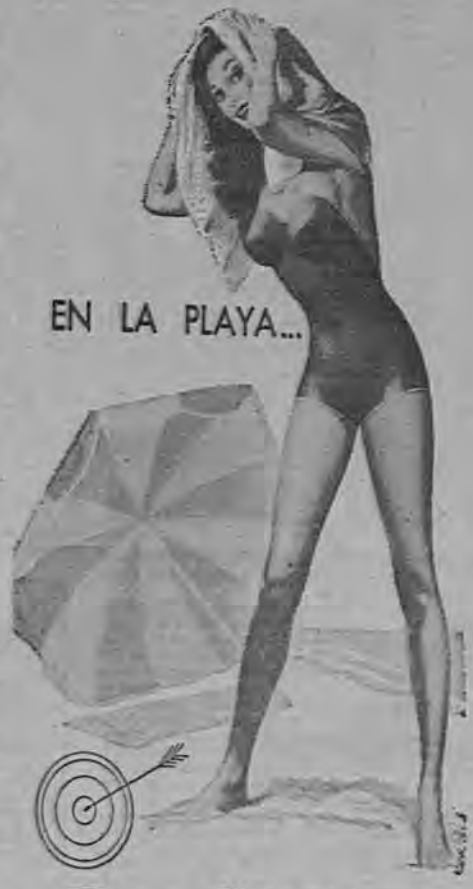
EN LA PLAYA...

La Orestina va a realizar la casa restauración de la prosa. Juan de Valdés dirá de este libro: "ninguno hay escrito en castellano donde la lengua esté más natural, más propia ni más elegante". Y no importa que ésta sea de traducción, pues contiene ya el modelo que han